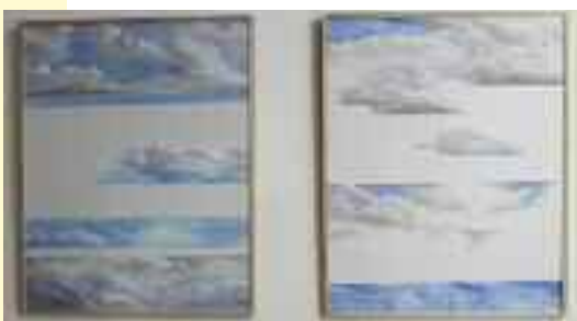
Die Himmelsbilder entstanden in der Kasseler Zeit. In Magdeburg hat sich der Professor der Hochschule Magdeburg anderen Themen zugewandt.