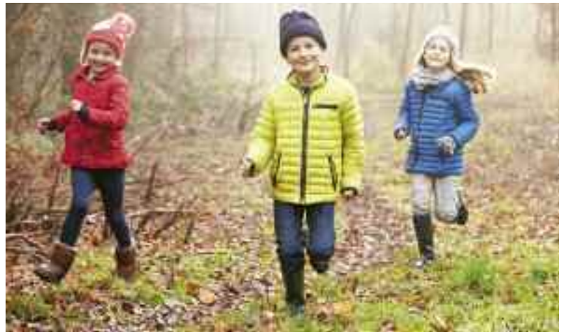
Frische Luft tut gut, auch bei Erkältung.