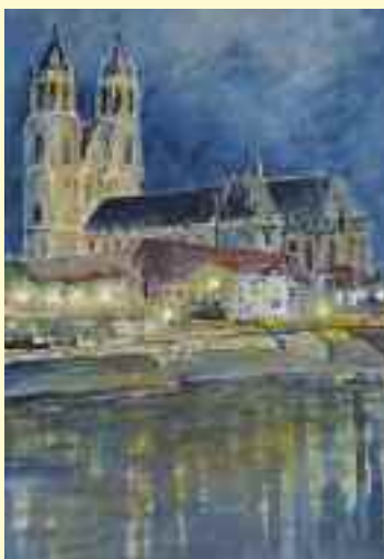
Malerei von Elke Scheffter.

„Bunt ist die Welt“ und „Der blaue Planet“ so die Themen der Ausstellung mit Werken der Magdeburger Malgruppe Heise, die seit 5. November in der Fachambulanz zu sehen ist. Die Künstler zeigen das Schöne der Erde, das unbedingt erhalten werden muss.