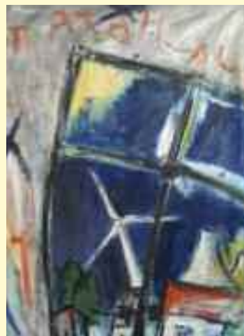
Die Bilder „Bienenweide“ und „Ausblick“ von Brigitte Ganß.